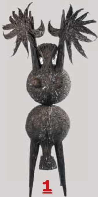
JOS ROSIER Assemblages

Ik experimenteer en assembleer sinds de jaren 90 met gevonden voorwerpen. Het medium bestaat bijna uitsluitend uit weggeworpen 'afgedankt' oud ijzer. Verzamelen en selecteren zijn belangrijk in 't ontstaan van het kunstwerk. De rode draad is de vergankelijkheid.