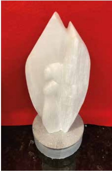
MARIETTE VERELST Beeldhouwen