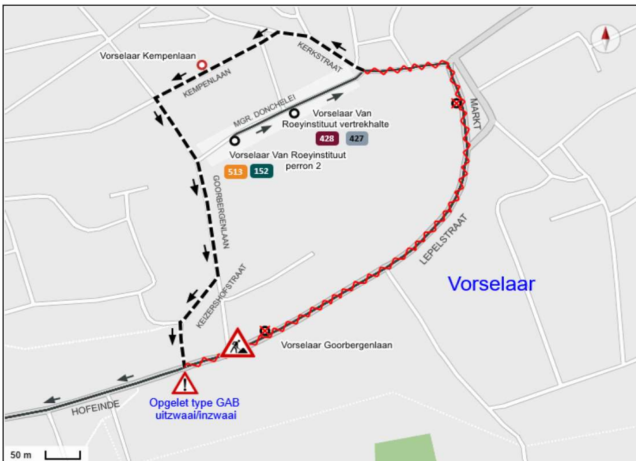
Plan 4: 152 - 427 - 428 - 513 vertrek KVRI en Dorp Vorselaar

Vorselaar: Goorbergenlaan (hoek Lepelstraat) en Markt