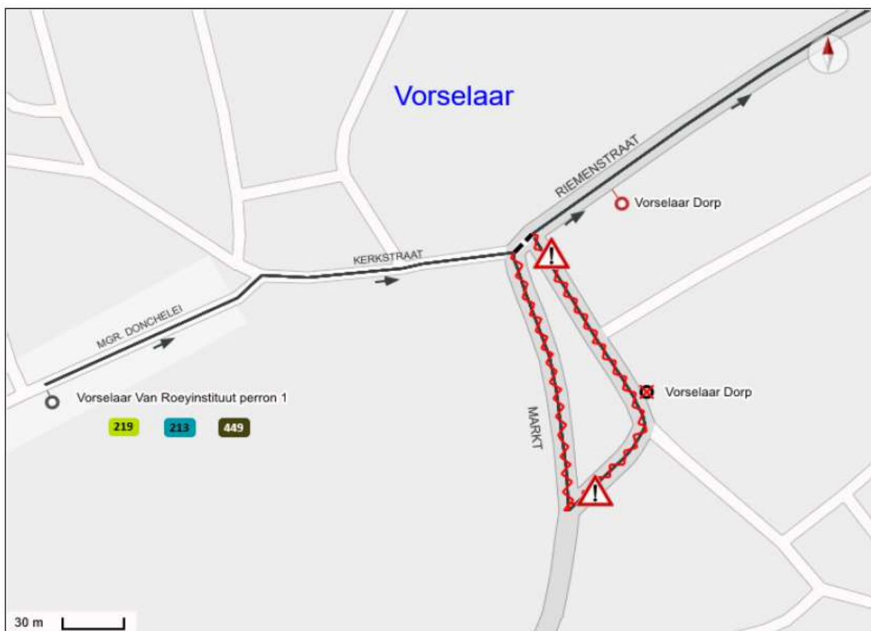
Plan 6: 213 -219 -449 vertrek KVRI Vorselaar